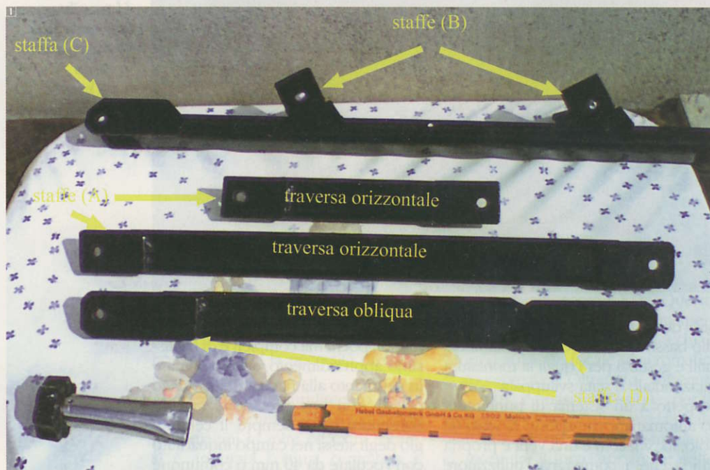
1. Le traverse autocostruite, con le staffe di collegamento. In basso a sinistra, il pomello utilizzato per serrare i dadi.

Il tutto doveva essere totalmente trasportabile, e ciò implicava l'esigenza di unire in modo non permanente, univoco e sicuro tutti i componenti del treppiede. Quindi, ho deciso di utilizzare la piattina, tagliata e forata opportunamente,